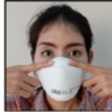
3.ใส่ N95 mask