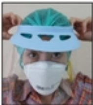
5.ถอดหน้ากากกัน กระเด็น