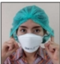
9.ถอดหมวกคลุมผม