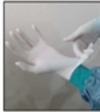
3.ถอดถุงมือคู่ที่ 2