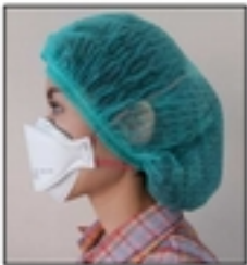
4.สวมหมวกคลุมผม