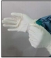
2.ถอดถุงมือคู่ที่ 1